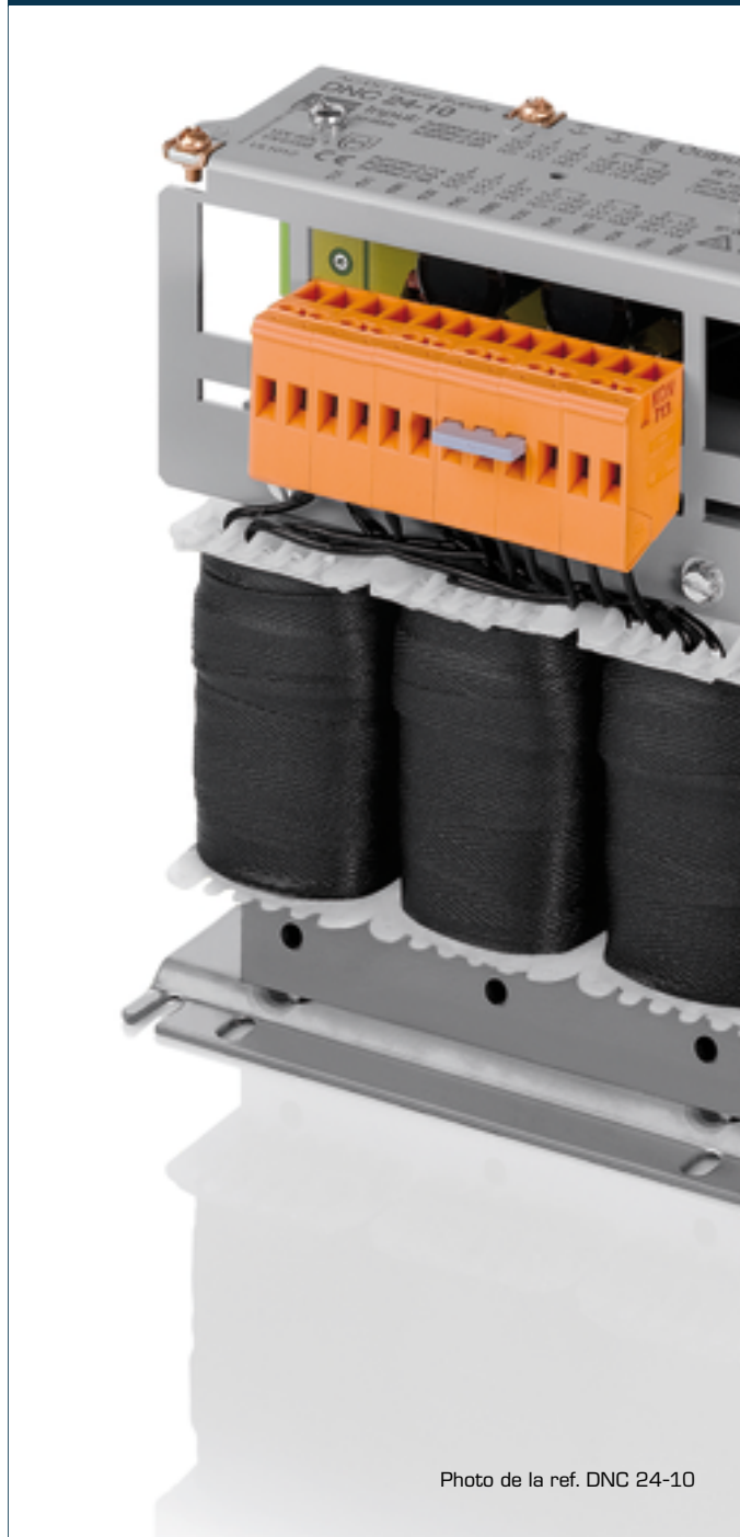
Photo de la ref. DNC 24-10