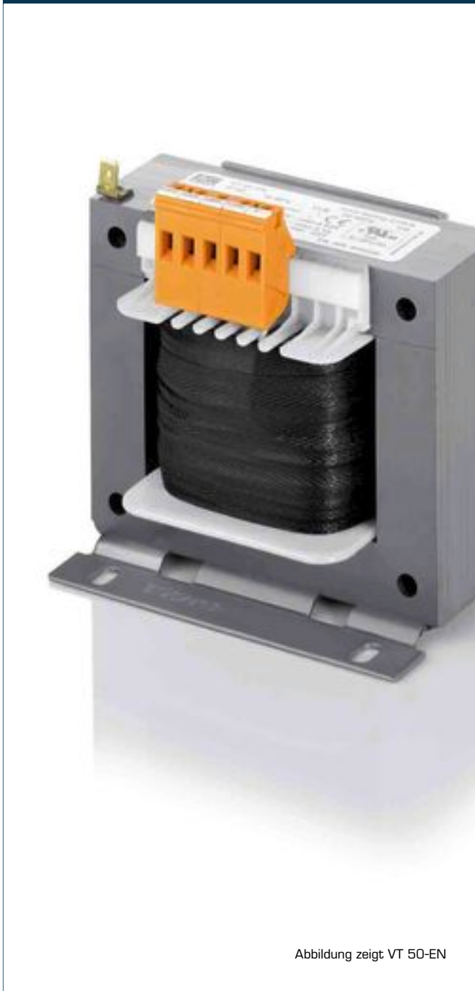
Abbildung zeigt VT 50-EN