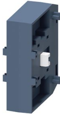
Mechanische Verriegelung für 3RT135, 3RT136, 3RT137