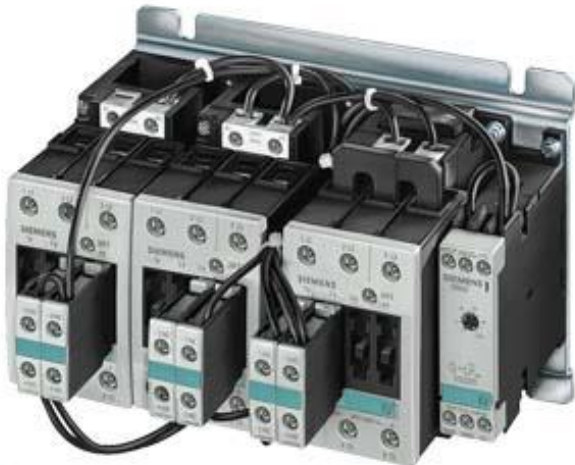
Figure à titre d'exemple

association de contacteurs étoile-triangle (déjà monté) avec relais temporisé latéral AC-3, 37 kW/400 V, 3 pôles taille S2, S2, S2 verrouillage électrique borne à vis 24 V CA, 50/60 Hz !!! Produit en fin de vie !! Le successeur est SIRIUS 3RA2 Successeur préféré : >>3RA2435-8XF32-1AC2<<