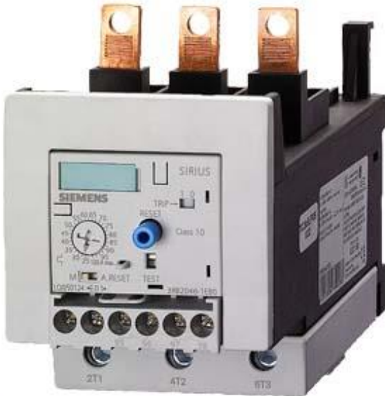
Figure à titre d'exemple

Relais de surcharge 25...100 A pour protection des moteurs taille S3, CLASS 20 Montage sur contacteur circuit principal : bornes à vis circuit auxiliaire : bornes à vis Réarmement automatique/manuel !!! Produit en fin de vie !! Le successeur est SIRIUS 3RB3 Successeur préféré : >>3RB3046-2XB0<<