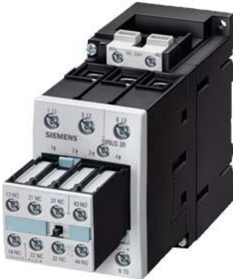
Figure à titre d'exemple

Contacteur de puissance, AC-3 40 A, 18,5 kW / 400 V 24 V CC, 2 NO + 2 NF 3 pôles, taille S2 borne à vis interrupteur auxiliaire non amovible pour applications SUVA !!! Produit en fin de vie !! Le successeur est SIRIUS 3RT2 Successeur préféré : >>3RT2028-1BB44-3MA0<<