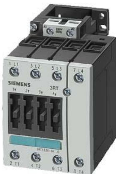
Figure à titre d'exemple

Contacteur, AC-1, 60 A, 125 V CC, 4 pôles, taille S2, borne à vis !!! Produit en fin de vie !! Le successeur est SIRIUS 3RT2