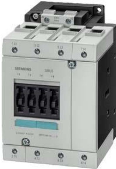
Figure à titre d'exemple

Contacteur, AC-1, 110 A, 120 V CA, 60 Hz, 4 pôles, taille S3, borne à vis !!! Produit en fin de vie !! Le successeur est SIRIUS 3RT2 Successeur préféré : >>3RT2344-1AK60<<