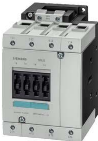
Figure à titre d'exemple

Contacteur, AC-1, 110 A, 400 V CA, 50 Hz / 60 Hz, 440 V, 60 Hz, 4 pôles, taille S3, borne à vis !!! Produit en fin de vie !! Le successeur est SIRIUS 3RT2