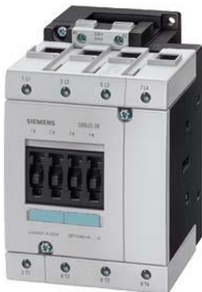
Figure à titre d'exemple

Contacteur, AC-1, 140 A, 48 V CA 50 / 60 Hz, 4 pôles, taille S3, borne à vis !!! Produit en fin de vie !! Le successeur est SIRIUS 3RT2