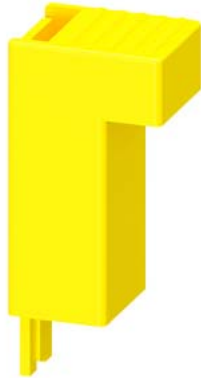
Control Kit pour contacteurs moteurs tailles S2,S3